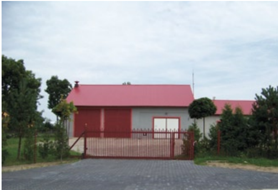
Budynek OSP Grabów nad Pilicą

Kolejnymi znaczącymi inwestycjami dla strażaków OSP to wykonanie remontów budynków, a w przypadku straży w Grabowie nad Pilicą wykonano rozbudowę budynku wraz z wymianą dachu i elewacji, a w tym roku wykonano zjazd. W 2013 r. wykonano remont strażnicy w Łękawicy łącznie z wymianą dachu i elewacji a także ułożono kostkę i wymieniono bramę wjazdową.