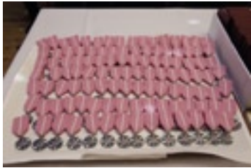
Medale za długoletnie Pożycie Małżeńskie