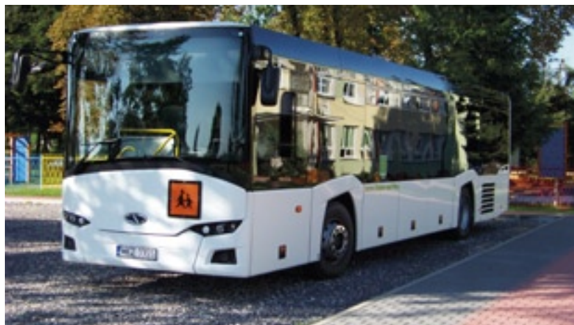
Autobus Solaris na nowym zajęździe przy ZS w Grabowie nad Pilicą

Został wybudowany zajazd dla autobusów dowożących dzieci, z którego bezpiecznie i bezpośrednio mogą przejść do szkoły.