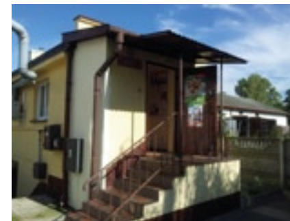
Gminny Ośrodek Pomocy Społecznej

W 2010 r. zaadoptowano budynki /dawna baza GS/ na potrzeby pracowników obsługi, które wymagały gruntownego remontu, dlatego na bieżąco wykonywane są prace wykończeniowe przy tych obiektach. Dbając o wizerunek przestrzeni publicznej wymieniono ogrodzenie, które jednocześnie ma zabezpieczyć przed przedostaniem się osób nieupoważnionych oraz zapewnić bezpieczeństwo w Punkcie Selektywnej Zbiórki Odpadów Komunalnych.