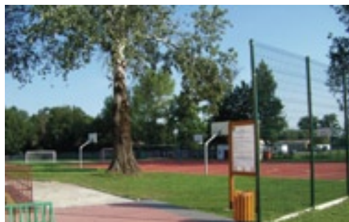
Wielofunkcyjne boisko szkolne

Inwestycja opiewała na kwotę 295 191,40 zł