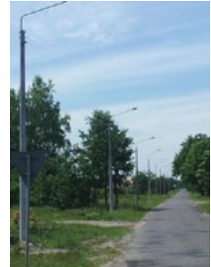
Oświetlenie ul. Kolejowa

W 2012 r. wybudowano odcinki oświetlenia ulicznego w Cychrowskiej Woli oraz przy ulicy Parkowej w Grabowie n/P. Jednak najbardziej oczekiwaną inwestycją z zakresu oświetlenia było oświetlenie ulicy Kolejowej, która jest ważnym odcinkiem dla naszych mieszkańców. Obecnie jesteśmy na etapie pozyskiwania środków zewnętrznych na wykonanie przebudowy oświetlenia ulicznego przy ulicy Kazimierza Pułaskiego w Grabowie nad Pilicą i Wyborowie, jest to odcinek ponad 3 km .