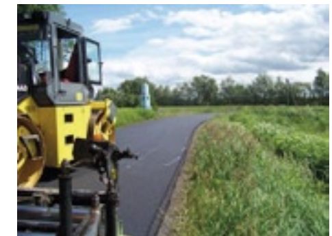
Droga w Paprotni

W 2013 r. kontynuowaliśmy rozpoczętą inwestycje na ulicy Polnej i została przedłużona o kolejne 850 mb. Jednocześnie w Budach Augustowskich wykonano nawierzchnię asfaltową na długości ok 1050 mb. W Brzozówce /Podlesie/ wykonano