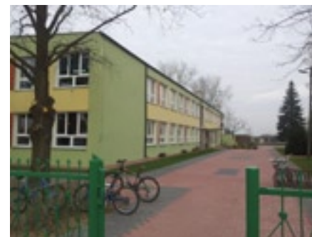
Chodnik do ZS w Grabowie nad Pilicą

Doposażenie oddziałów przedszkolnych to inwestycja na kwotę 204 085,35 zł.