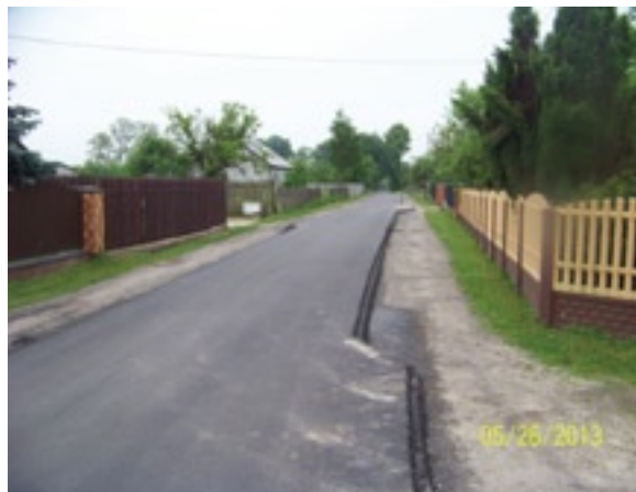
Droga w Budach Augustowskich