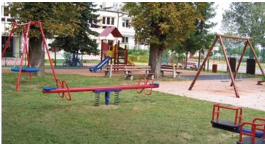
Plac zabaw przy Zespole Szkół

Inwestycja opiewała na kwotę 217 996,65 zł