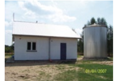
Stacja uzdatniania wody w Kępie Niemojevskiej

Sieć wodociągów, kanalizacji, drogi – to właśnie infrastruktura sprzyjająca rozwojowi działalności gospodarczej, w tym również rolniczej oraz budownictwa mieszkalnego i letniskowego. W najbliższych latach należy w jak najwyższym stopniu wykorzystać możliwości jakie dało nam przystąpienie do Unii Europejskiej, a w szczególności pozyskiwanie środków z funduszy europejskich.