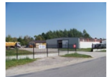
Referat Obsługi Techniczno Gospodarczej