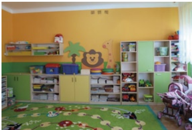
Sala oddziału przedszkolnego w Augustowie

w Zespole Szkół w Grabowie nad Pilicą i jeden w Publicznej Szkole Podstawowej w Augustowie. Sale zmieniły się nie do poznania wymieniono meble, ławeczki