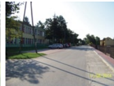
Parking i chodnik przed ZS w Grabowie nad Pilicą