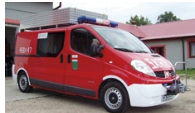
Samochód specjalny OSP Grabów nad Pilicą