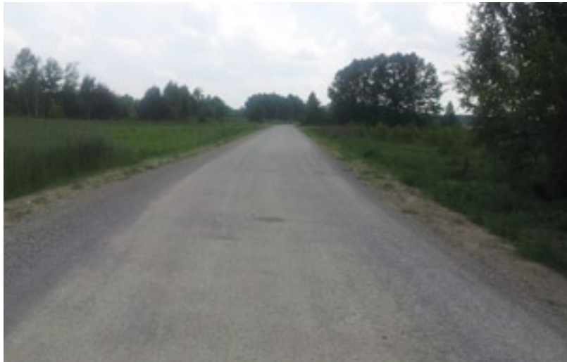
Droga powiatowa Grabów nad Pilicą - Augustów