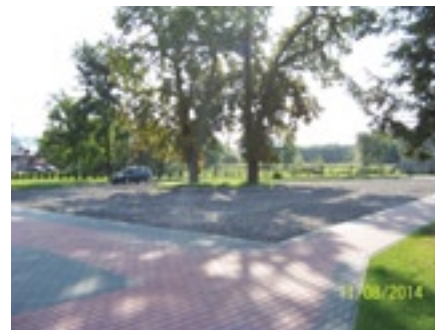
Zajazd dla autobusów przy ZS w Grabowie nad Pilicą