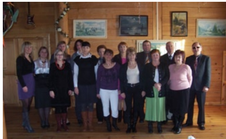
Uczestnicy projektu „Florystyka i bukieciarstwo”

Jako Beneficjent i realizator projektu systemowego „Zmieńmy siebie” oferuje wsparcie dla osób z terenu Gminy Grabów nad Pilicą korzystających ze świadczeń pomocy społecznej, będących osobami bezrobotnymi bądź nieaktywnymi zawodowo. W latach 2011 i 2012 w prowadzonych działaniach udział wzięło 12 osób w tym 10 kobiet i 2 mężczyzn. Wszyscy ukończyli udział w projekcie zgodnie z zaplanowaną ścieżką wsparcia. W 2013 r. grupę docelową stanowiło 6 kobiet, z którymi zawarte zostały kontrakty socjalne i które będą prowadzone przez cały okres ich udziału w projekcie. W obecnym roku projekt jest nadal realizowany a bierze w niej udział 8 osób.