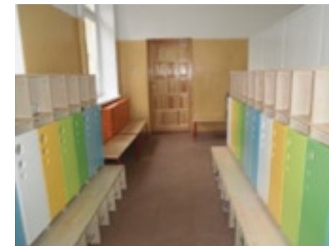
Nowoczesna szatnia dla przedszkolaków

z krzesłami, dywany, a także wzbogacono kąciki zabaw dla dzieci oraz zaplecze pomocy dydaktycznych. Zadbano o komfort i bezpieczeństwo dzieci poprzez montaż rolet okiennych i nowe obudowy grzejników. Zakupiono również nowy duży telewizor wraz z wieżą spełniającą również funkcje DVD. Podkreślić należy również wymianę urządzeń sanitarnych w łazience, gdzie zamontowano nowe urządzenia, przystosowane do wzrostu dzieci.