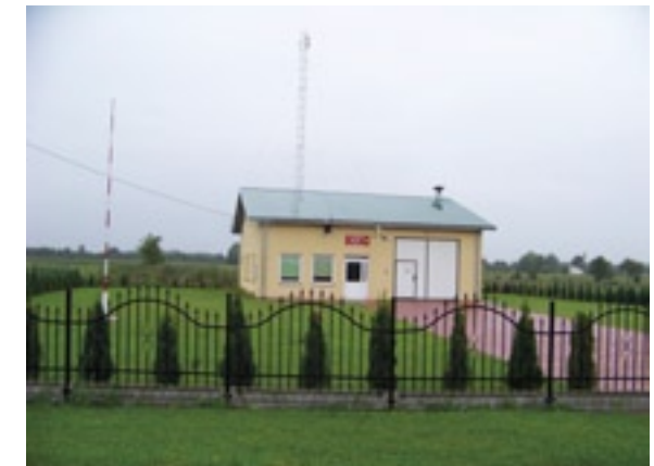
Budynek OSP Grabowska Wola