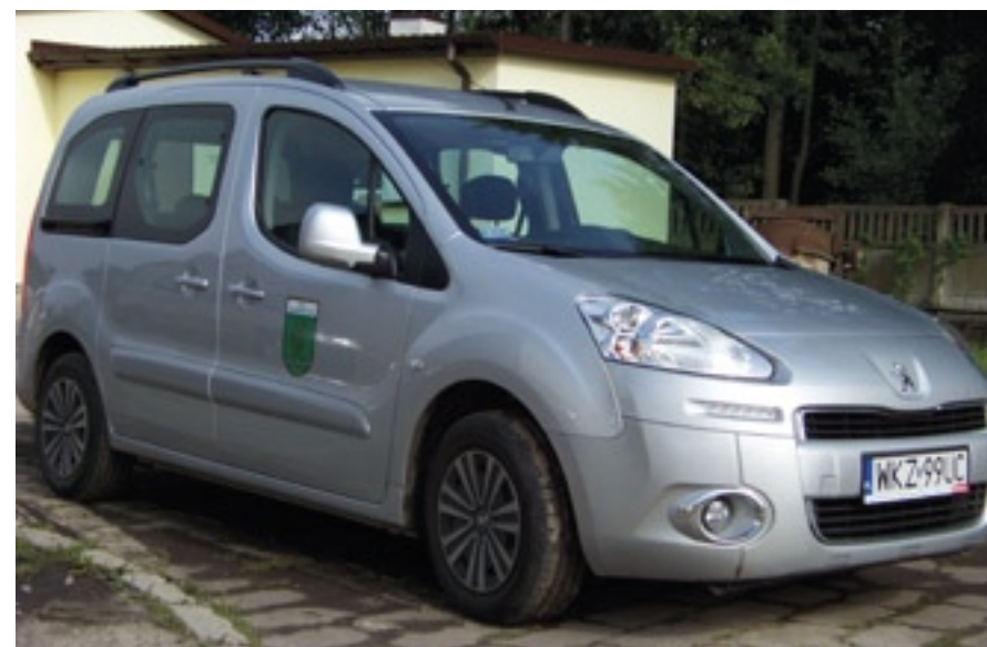
Nowy samochód Referatu Obsługi Gospodarczej