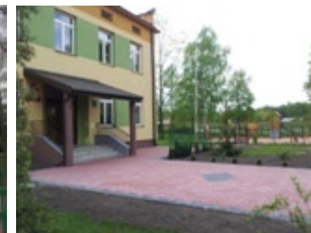
Wejście do PSP w Augustowie

Rok 2013/2014 był dla szkół w Grabowie nad Pilicą i Augustowie okresem wielu zmian. Zupełnie nowy charakter uzyskały place przed wejściem na których została ułożona kostka i uporządkowano teren zielony. W myśl ekonomii została wykonana termomodernizacja nowego skrzydła budynku Zespołu Szkół polegająca na wymianie starych drewnianych okien na nowe plastikowe które mają zmniejszyć zapotrzebowanie i zużycie energii cieplnej w obiekcie.