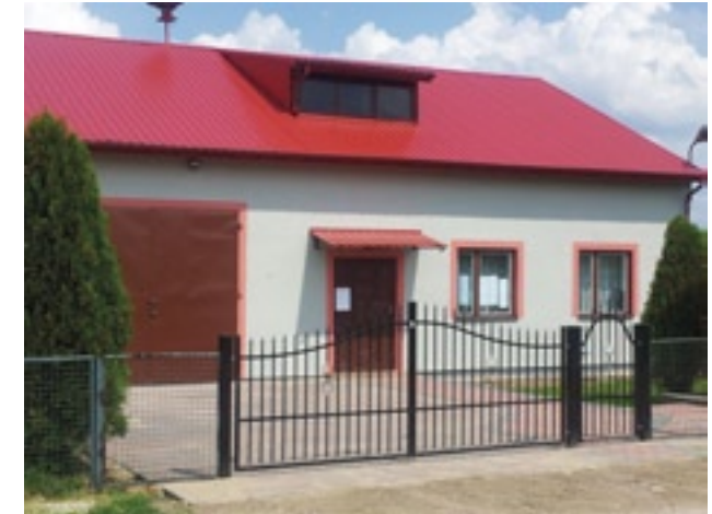
Budynek OSP Łękawica