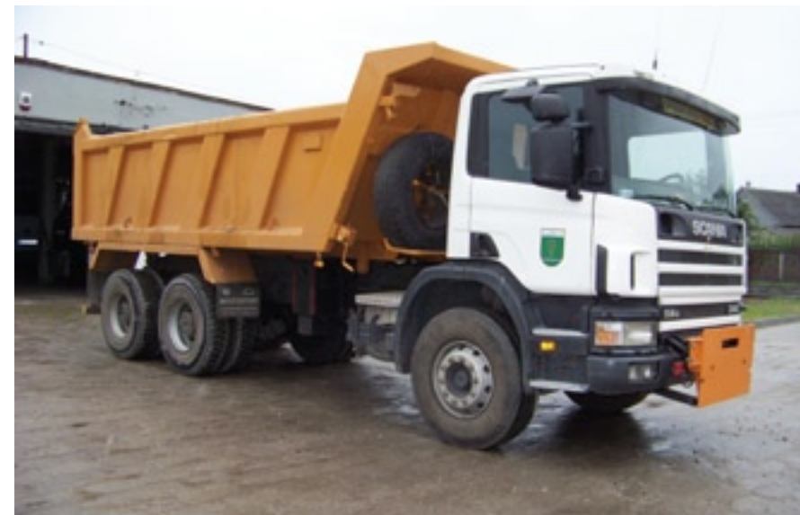
Samochód Scania zakupiony dla grupy remontowej UG