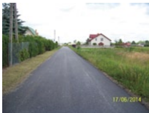
Droga ul. Polna w Grabowie nad Pilicą