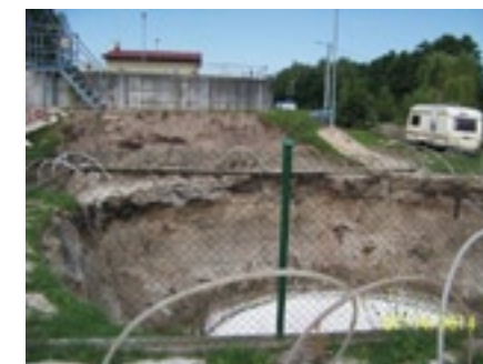
Prace przy modernizacji oczyszczalni ścieków